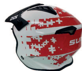
Déco casques : Design : S3 Réalisation : Cochet Publicité Biel/Bienne