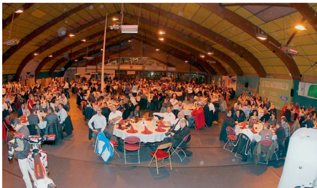
Aufmerksames Publikum in der Veranstaltungshalle

Es ist allgemein bekannt, dass der Kanton Jura als die Hochburg des Motorsports in der Schweiz gilt. Hier finden Strassenrennen, Events im Trial, Enduro Motocross und Supermoto statt. Nicht zu vergessen natürlich auch die Pocket-Bike-Rennen, das Auto-Strassenrennen und die Auto-Rallye sowie die Kartrennen. Hinzu kommen Langlauf, Hockey, Fussball, Laufwettkämpfe und weitere, eher unauffälligen Disziplinen - im Jura