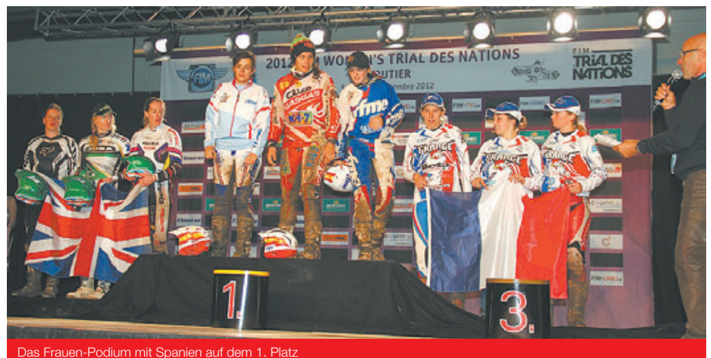
Das Frauen-Podium mit Spanien auf dem 1. Platz