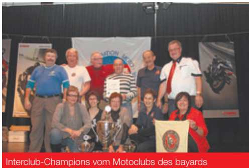
Interclub-Champions vom Motoclubs des bayards

Fair Play und Freundschaft - unter diesem inoffiziellen Motto hatten sich die Gäste für diese Veranstaltung offenbar verabredet und bedankten sich mit strahlenden Gesichtern bei den Organisatoren. Treffpunkt Innerberg hiess es für die Bi-