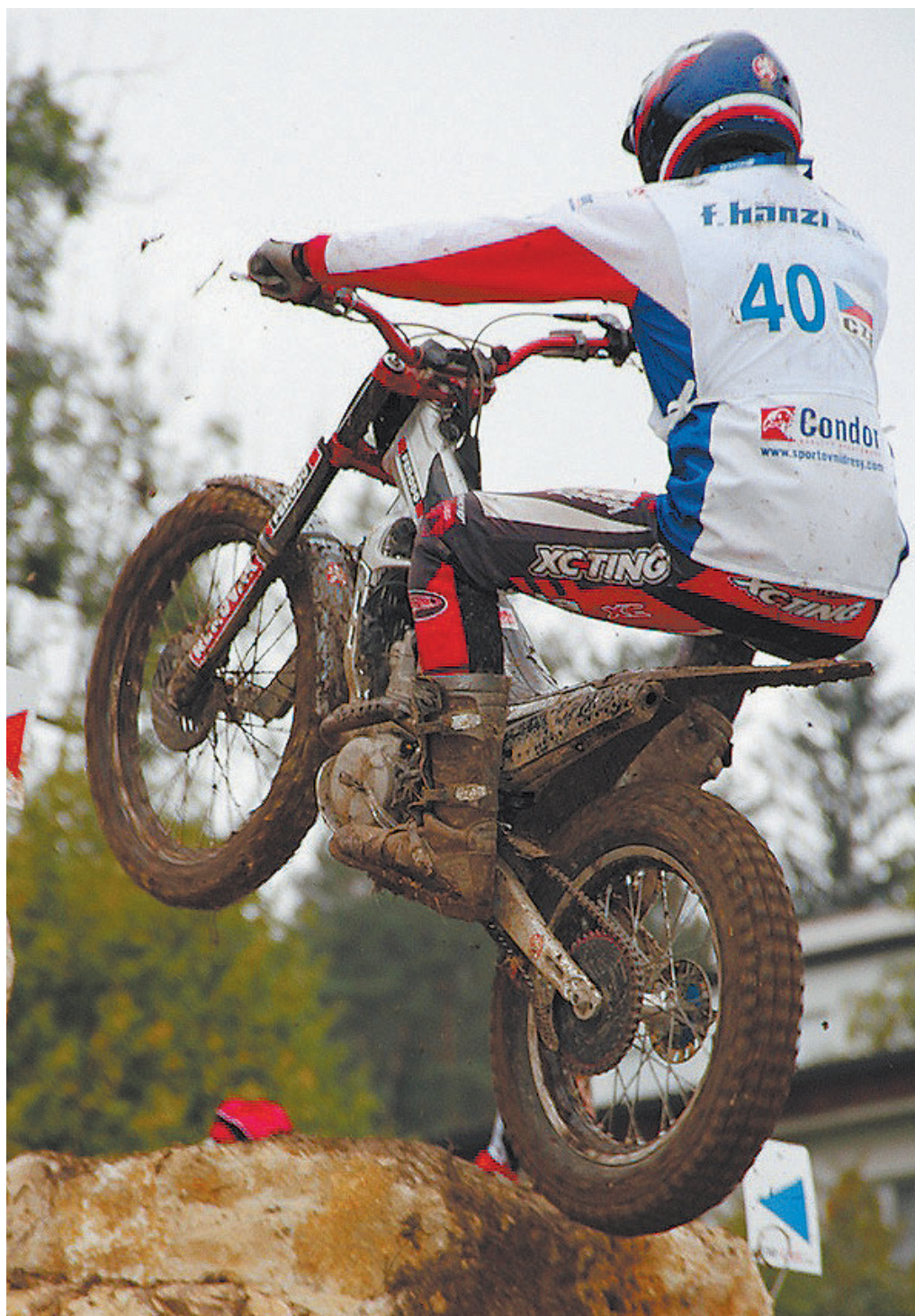
Trial, ein einzigartiges Spektakel

Zum ersten Mal in der Geschichte des Motorsports, organisierte die Schweiz ein Trial der Nationen. Die Mannschaftswettbewerbe der Frauen und Männer fanden unter einem Dach statt. Start und Ziel war in der grossen Halle des Forum d'Arc. Der Rennpark war in drei Sektoren aufgeteilt, und das Publikum konnte sich entweder im Zielbereich mitfiebern oder mit Shuttle-Bussen die anderen Rennabschnitte besuchen. In den natürlich angelegten Sektoren wurde bei diesem anspruchsvollen Rennen schnell die Spreu vom Weizen getrennt. Manche Passagen konnten noch nicht einmal zu Fuss überquert werden. Bekanntlich sind die Fahrer aber hartgesottene Akrobaten, die vor keinem Hindernis Halt machen. Diejenigen, die näher am Forum standen, verpassten allerdings die beeindruckendsten und rutschigsten Passagen, in denen uns diese mutigen Athleten bewiesen, dass sie ihr Können in jeder Position meistern. Trotz dieser schwierigen Bedingungen hatten die Mädchen immer ein Lächeln auf den Lippen. Bemerkenswert bei dieser tollkühnen Sportart ist vor allem die Fairness unter den Fahrern der verschiedenen Nationen. Sich ge-