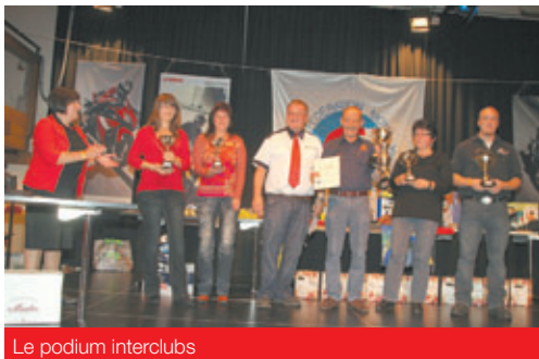
Le podium interclubs

Le Fair Play et l'amitié sont réunis sous un même toit et les organisateurs ont été récompensés par tous ces sourires avant les fêtes de fin d'année.