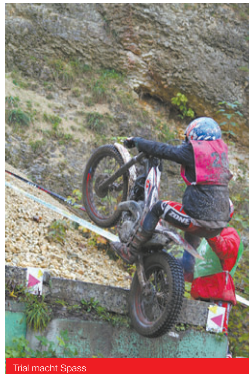
Trial macht Spass

Das Lächeln der scharmanten Damen war sozusagen noch das Tüpfelchen auf dem i.