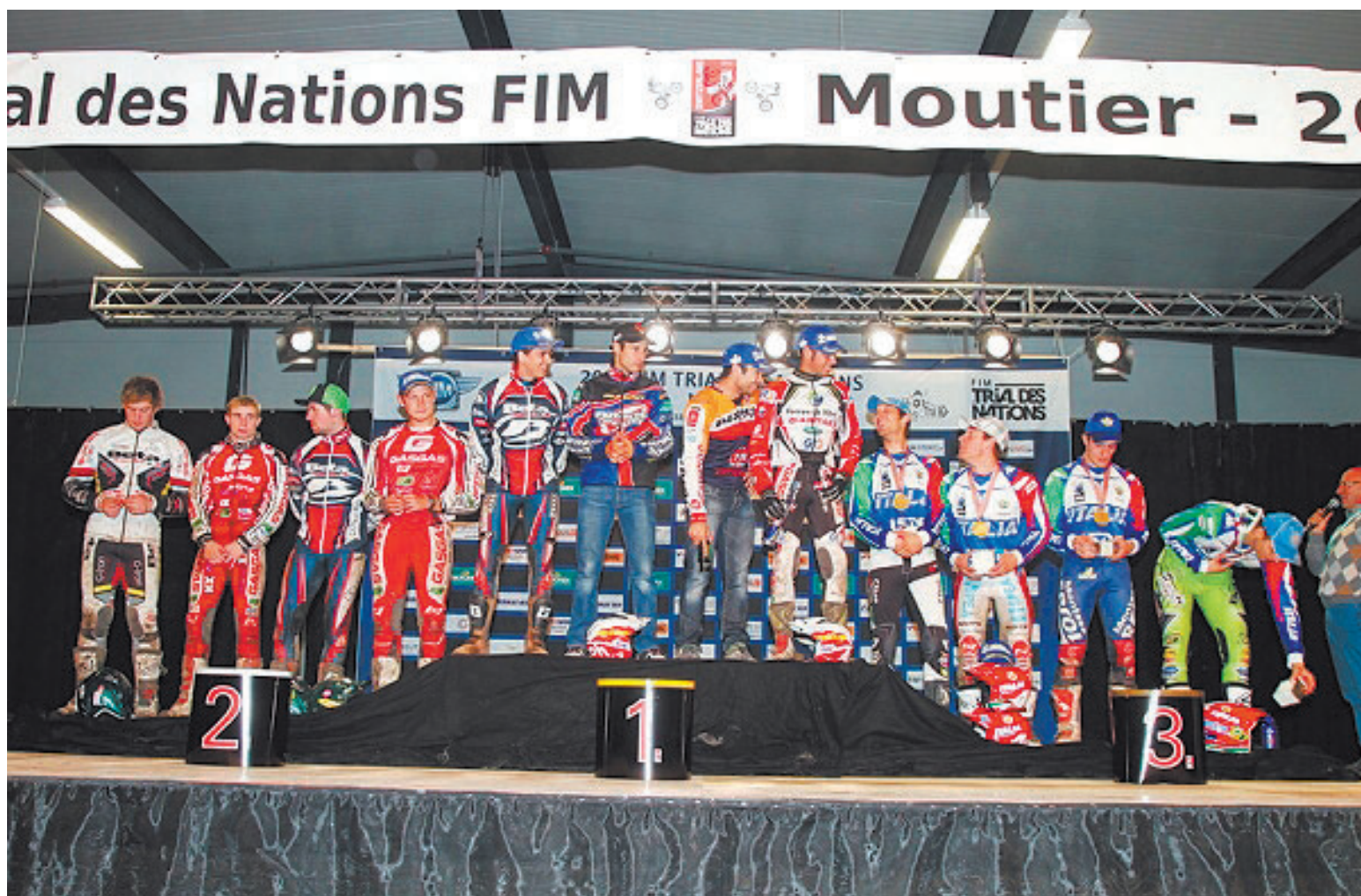
Le gratin mondial sur le podium