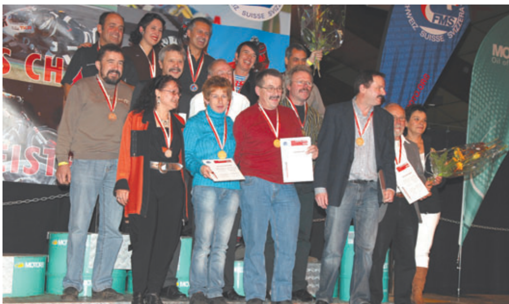
An der Meisterfeier 2012