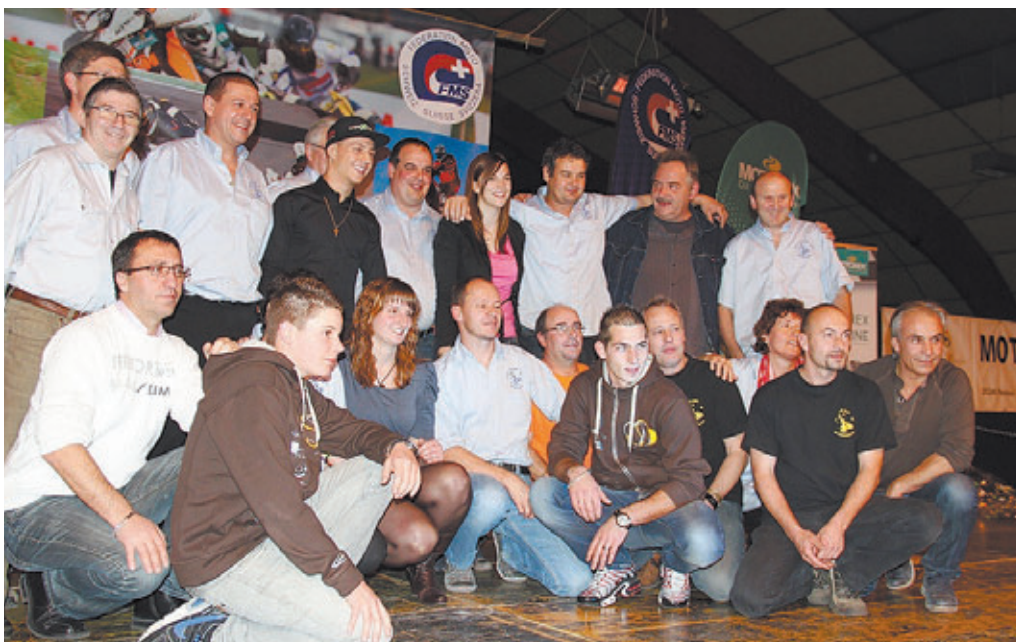
Der Moto-Club Boécourt grüsst Dominique Aegerter