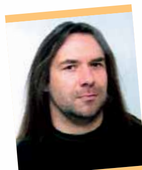
Roger Bantli Cat. Superstock