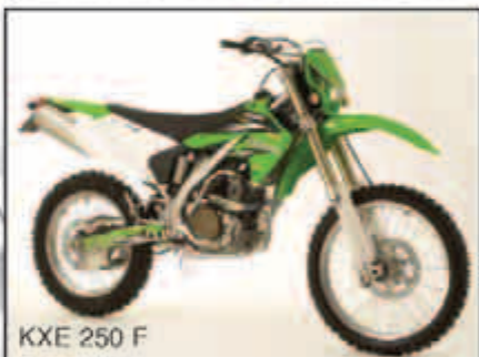
KXE 250 F

Places assises: 2 Poids à sec: 106 kg Prix: CHF 12 450.- net 7.6 % TVA incl.