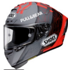
SHOEI SHOEI Integralhelm X-Spirit III MM93 Black Concept 2.0, TC-1, schwarz-rot