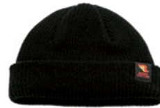
RIDING CULTURE Riding Culture Kappe Fishman Beanie, schwarz