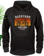
BACKYARDRACING Backyard Racing Hoody Moto Sunset, schwarz

In 4 Preisklassen findest Du schnell das passende Geschenk für Deine liebsten!