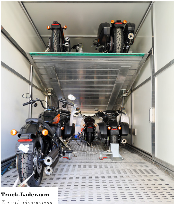
Truck-Laderaum Zone de chargement