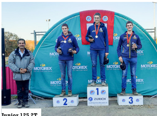
Junior 125 2T