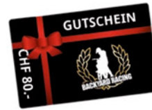
BACKYARDRACING Backyard Racing Geschenkgutschein 80 Franken