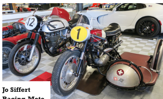
Jo Siffert Racing-Moto