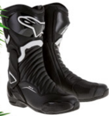
Alpinestars Alpinestars Stiefel SMX-6 V2, schwarz weiss