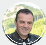
Walter Wobmann: FMS Zentralpräsident Président central FMS Presidente della FMS