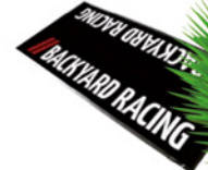
BACKYARDRACING Backyard Racing Montage Fussmatte, 95 x 200cm