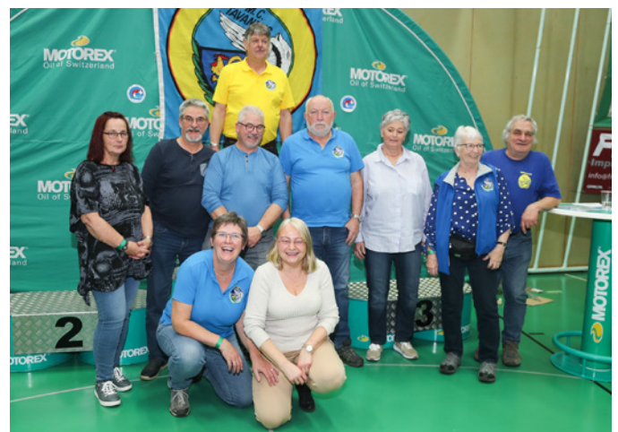
Die freiwilligen Helfer des Moto-Club Tavannes