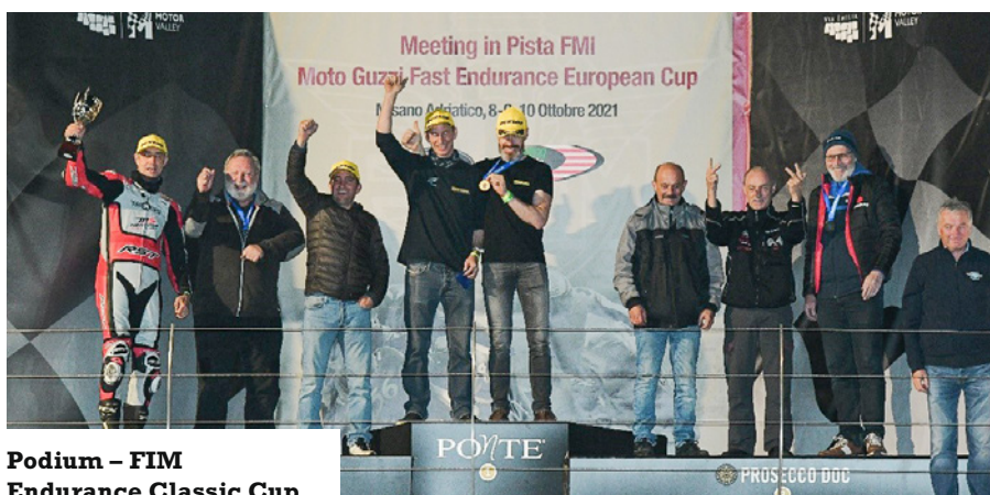
Podium – FIM Endurance Classic Cup