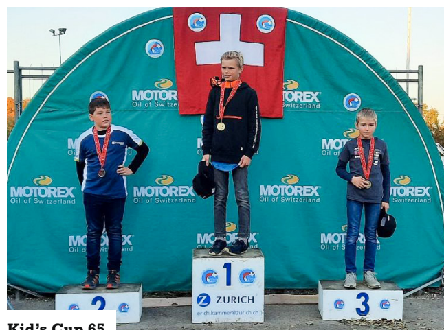
Kid's Cup 65