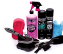
Muc-Off Muc-Off Ultimate Motorcycle Care Kit