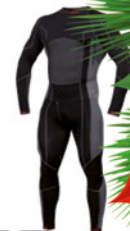
IBSS IBSS Thermo Einteiler 365, sch grau