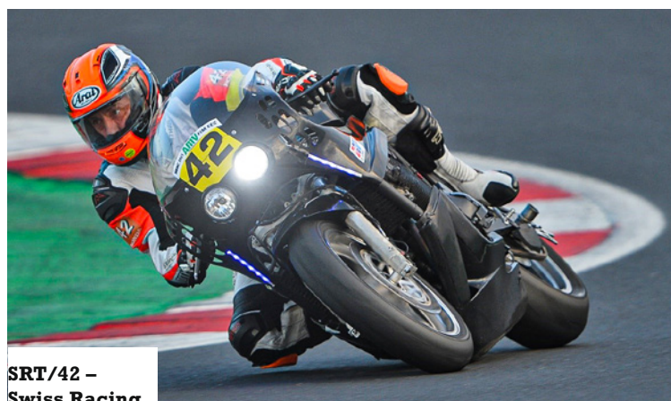
SRT/42 – Swiss Racing