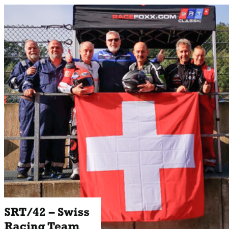
SRT/42 – Swiss Racing Team

Lors de la finale à Misano, le Team Suisse «42SRT» a réitéré une bonne performance, récompensée par un troisième rang et une médaille de bronze dans le classement annuel. III