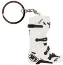
Alpinestars Alpinestars 2021 Schlüsselanhänger New Tech 10, weiss