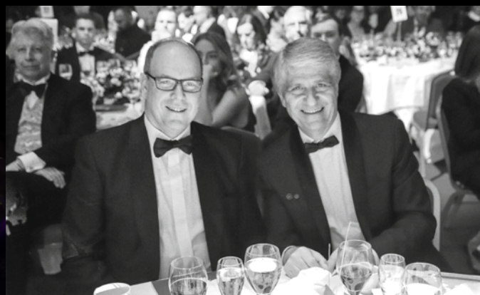
Mit einem Fürst und Motorsport-Befürworter wie «Rainer III» von Monaco, hätten wir keine Probleme in der Schweiz