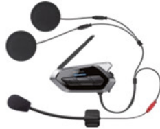
SENA Sena 50R Mesh Kommunikationssystem