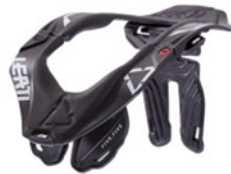
LEATT Leatt Neckbrace GPX 5.5, schwarz