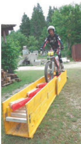
Passage du/des pilotes sur la moto ou à côté. Le premier bac contient aussi de l'eau, le second uniquement les brosses.

PROPRIÉTÉS : INITIATEUR – WALTER WERMUTH (TRIALIST) ; RÉALISATION – JULIEN RYF ET AL. (LYCÉE TECHNIQUE BIENNE) EIGENTUM : INITIANT – WALTER WERMUTH (TRIALIST) ; REALISATION – JULIEN RYF ET AL. (TECHNISCHE FACHSCHULE BIEL)