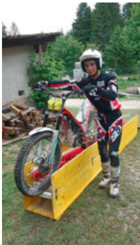
Passage du/des pilotes sur la moto ou à côté. Le premier bac contient aussi de l'eau, le second uniquement les brosses.