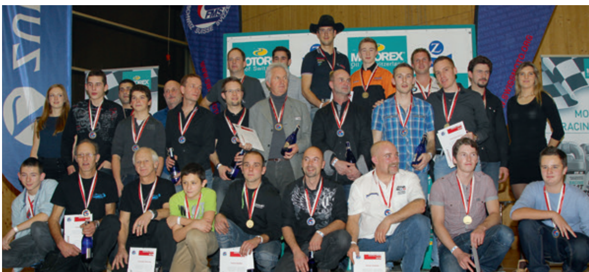
Strasse / Route