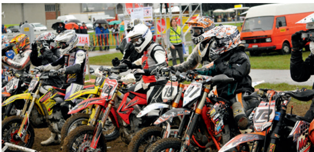
Volle Startfelder Grilles de départ remplies

der noch nicht gesichert, der Besitzer der Anlage macht uns mit seinen finanziellen Forderungen das Leben schwer, aber wir suchen eine Lösung.