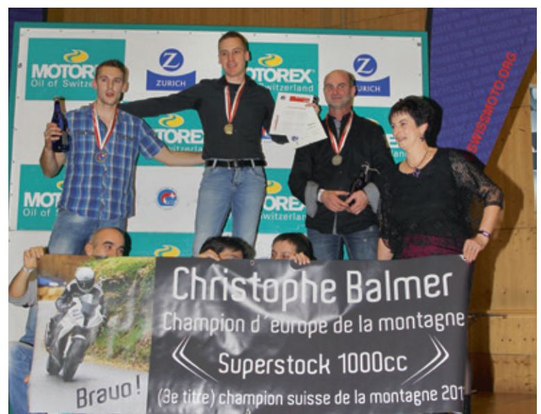
Bergrennen / course de côte