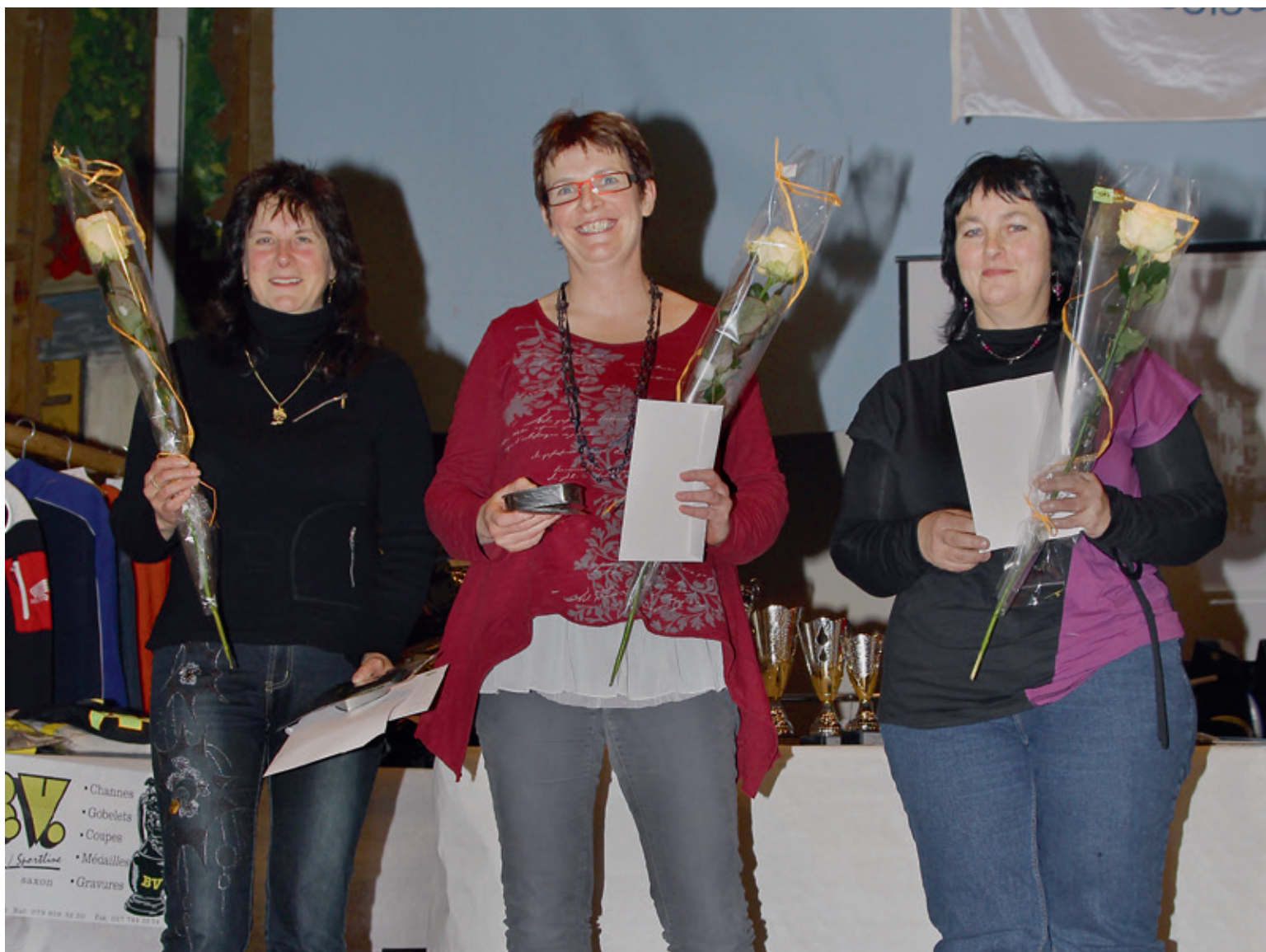
Le podium des passagères.