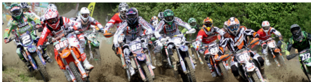
Start zum Motocross-Finale der Schweizermeisterschaft