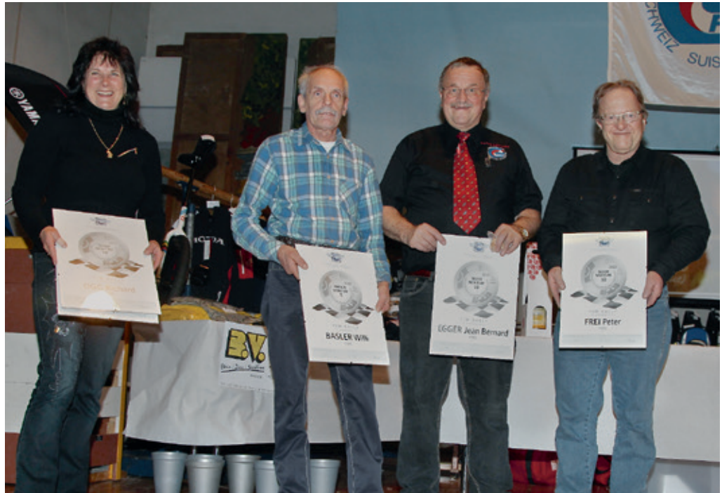
Remise des prix des Meritums FIM.

Ils sont vraiment sympathiques nos amis les «Combières», ils se sont mis en quatre pour recevoir les pilotes du tourisme dans une magnifique région où le froid glacial nous rappelle que nous sommes en altitude. Journée de carte postale avec un soleil et une neige qui scintillent de tous ses atours. La visite du Juraparc avec ses loups, ours, bisons et autres dans un environnement jurassiens qui convient bien à ces animaux sauvages. La découverte d'une scierie à l'Abbaye ainsi que du magnifique musée du vacherin ont ravi les participants. L'apéritif qui se déroulait au musée nous a fait redécouvrir les saveurs d'antan d'un fromage gouteux et savoureux. Sur le coup des 19 heures, tout le monde s'est