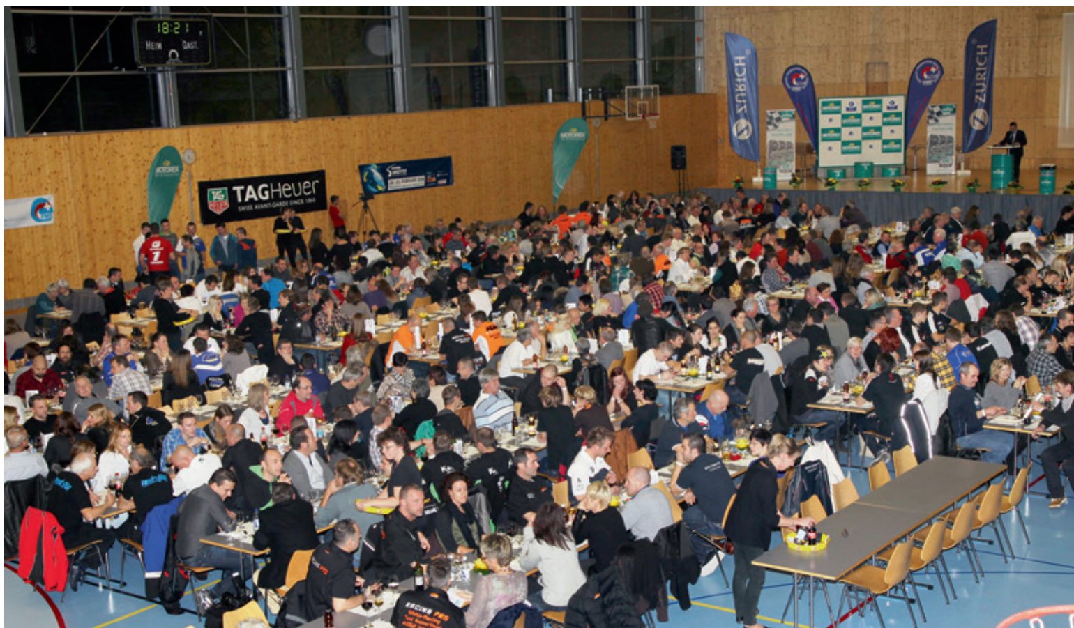
FMS-Meisterfeier. 600 Sportler, Gäste und Teams freuen sich in Huttwil. 600 sportifs, invités et équipes se réjouissent à Huttwil.